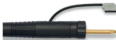
Zentralanschluss GF (F ZA)